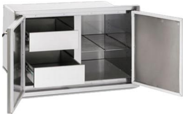
California Professional Unterschrank 36" 2 Türig