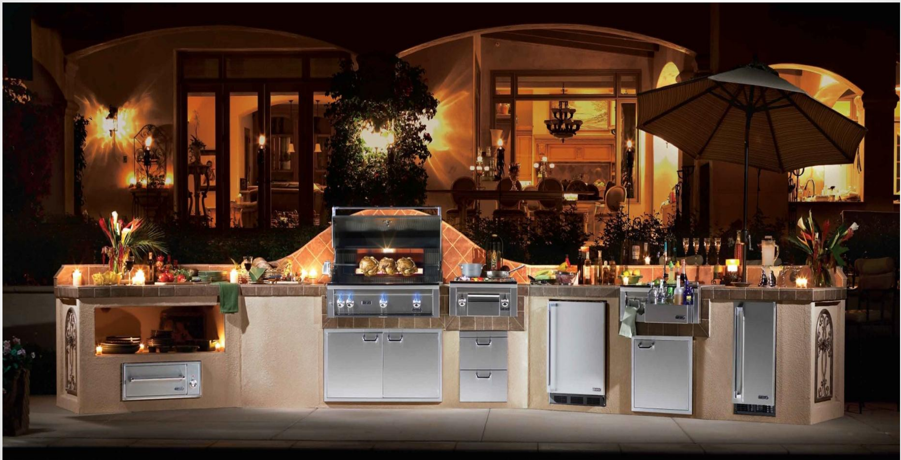
California LYNX Außenküche Island Hero