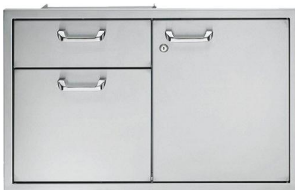
California Professional Unterschrank 36" 2 Türig mit Schublade

Die genauen Einbaumaße und weitere Details erhalten Sie gerne auf Anfrage oder hier (klick) .