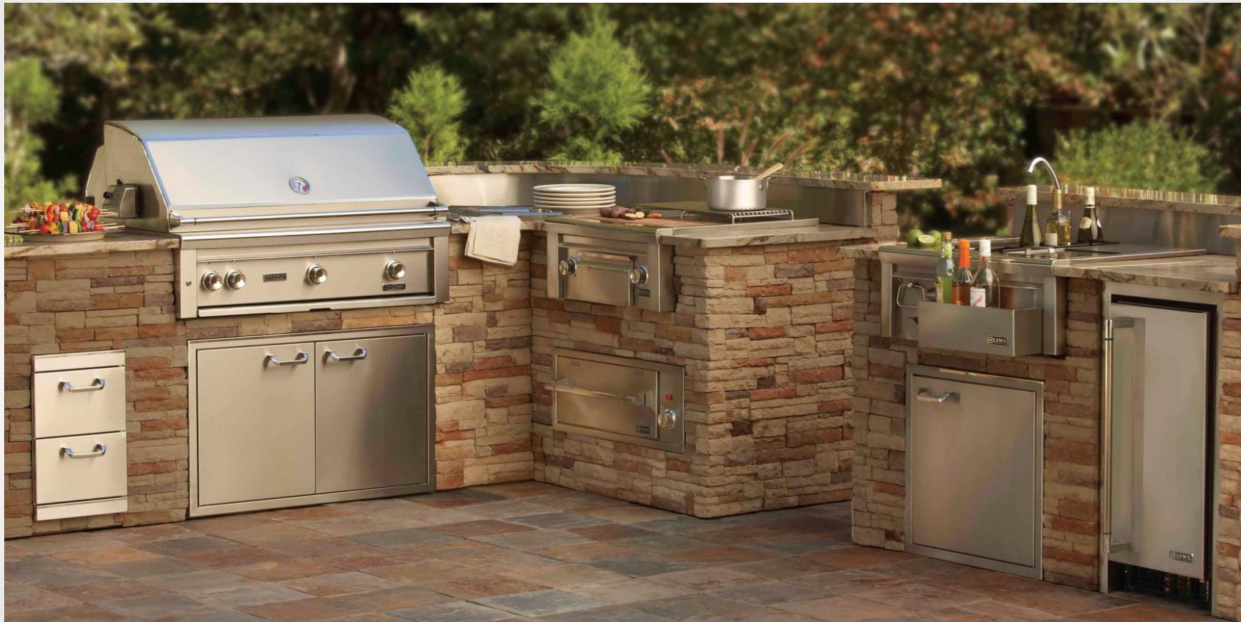
California LYNX Außenküche Natural Stone Heaven